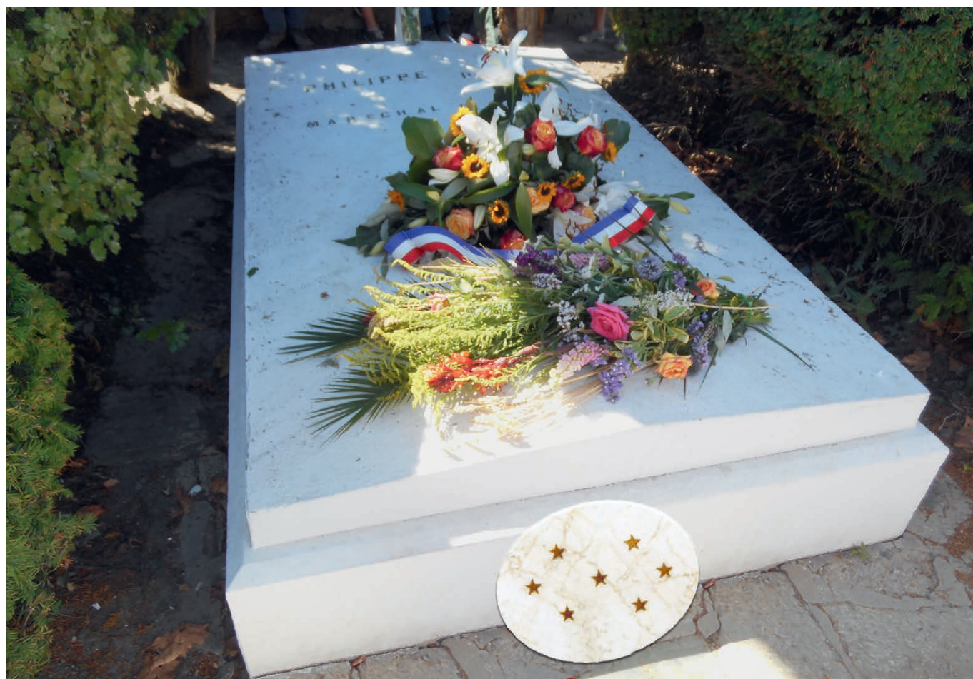
Tombe du maréchal Pétain au cimetière de Port-Joinville (Île d’Yeu). « Mort, il parle encore. » (He 11,4)

Mais si nous sommes venus ici aujourd’hui, c’est moins pour exalter vos gloires, monsieur le Maréchal, que pour contempler vos mystères douloureux, comprenant que vous vous êtes offert en victime pour notre pays. Durant votre procès, un homme dont on ne prononcera pas le nom a dit que vous étiez pour lui un mystère. Il n’est pas donné à tout le monde de percevoir la lumière aveuglante qui émane de votre vie.