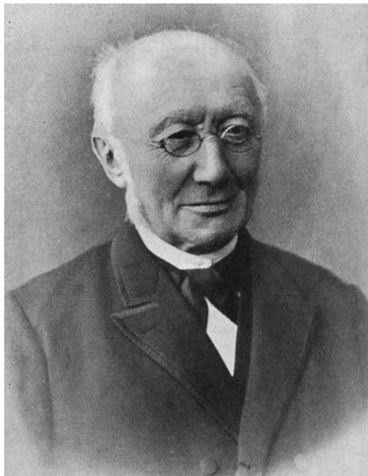
Ludwig Windthorst (1812-1891) was jarenlang de voorzitter van het Zentrum en in die functie de tegenspeler van Bismarck tijdens de Kulturkampf . « Wij nemen deel aan een verschrikkelijk duel: de strijd van het geloof tegen de ongelovigheid. Aan de ene kant de opstand tegen God, aan de andere kant de onderwerping aan het Kruis. »

tie waren het (katholieke) keizerrijk Oostenrijk en het (protestantse) koninkrijk Pruisen. De Bond stond vanaf het begin dan ook in het teken van de spanning tussen beide rivalen, zeker nadat het Congres had besloten om het Rijnland en Westfalen toe te voegen aan Pruisen. Het opzet van die aanhechting was de schepping van een buffer tegen Frankrijk, maar in de praktijk werd de katholieke bevolking van de Duitse gebieden in het westen uitgeleverd aan de protestantse machthebbers in Berlijn!