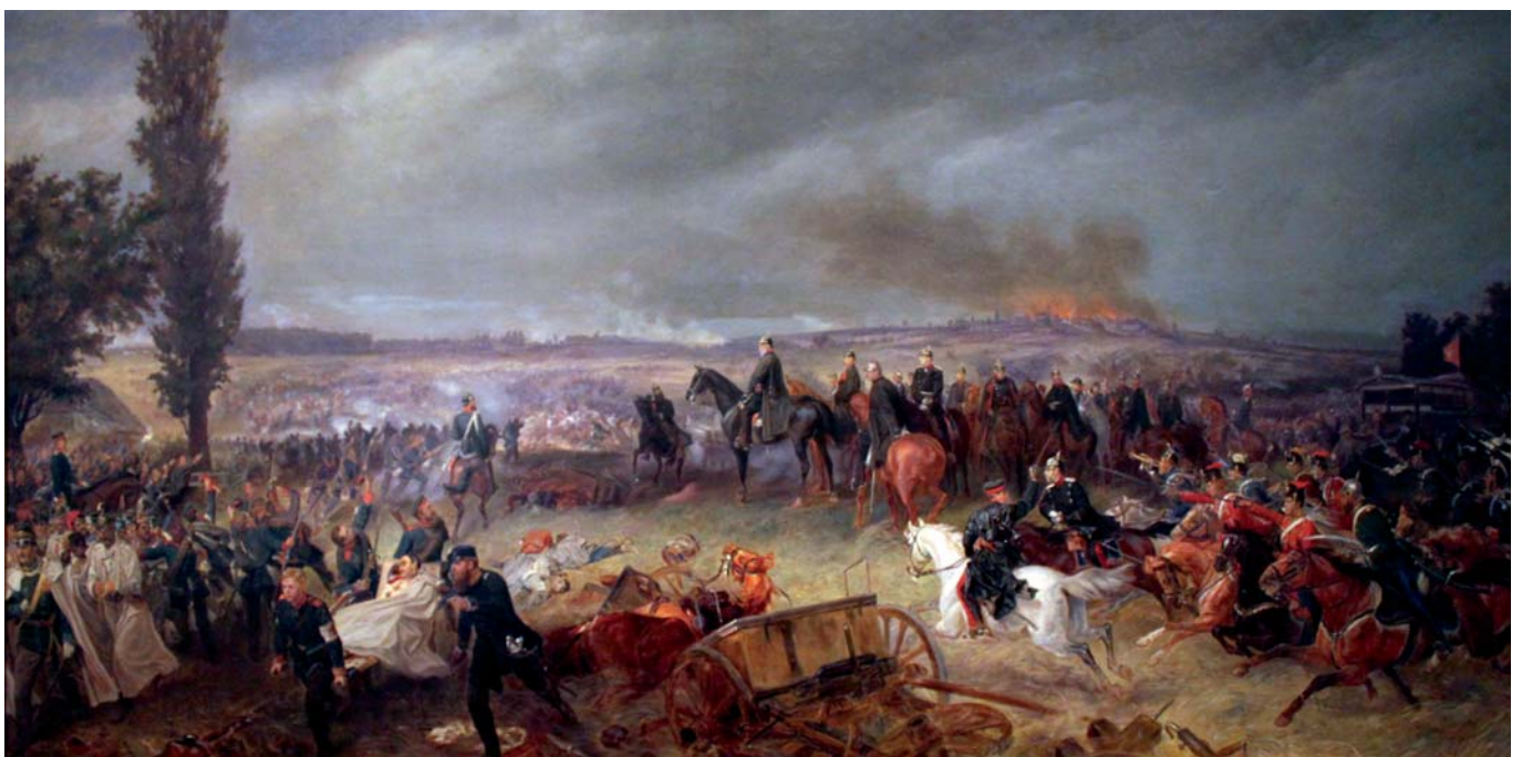
De slag bij Sadowa, 3 juli 1866. Schilderij door Georg Bleibtrau. Centraal koning Wilhelm van Pruisen, de latere keizer van het eengemaakte Duitsland. Achter hem, vanaf de rug gezien, kanselier Otto von Bismarck. Rechts van Bismarck de magere gestalte van Helmuth von Moltke, hoofd van de generale staf en militair architect van de overwinning op de Oostenrijkers.

De Duitse katholieken, « gevormd in de lijn van Gregorius XVI en Pius IX, verenigden zich door in 1865 het Zentrum te stichten, de Centruumpartij, die in 1871 haar intrede deed in de Rijksdag. Onder het voorzitterschap van Ludwig Windthorst, een briljant politiek denker en een fervent mysticus, namen de leden van het bondgenootschap het devies " Voor de waarheid, de vrijheid en het recht " aan. Hun