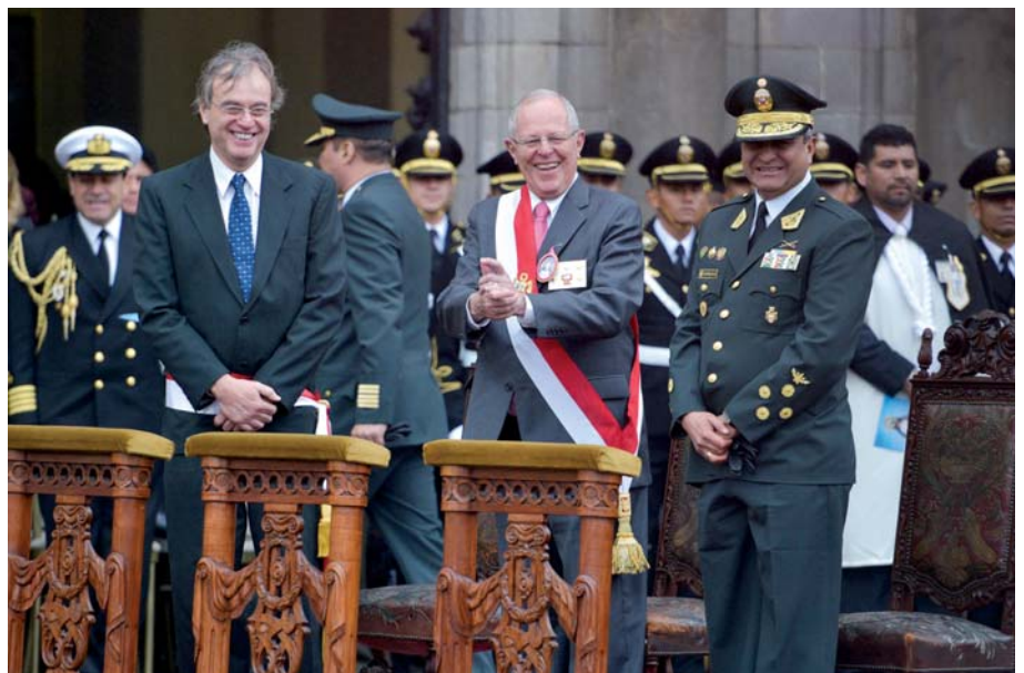
President Kuczynski van Peru (midden) tijdens een processie ter ere van de H. Rosa van Lima, patrones van de Nationale politie (30 augustus 2016).

Voor zijn vertrek uit Rome had de paus in een interview met La Civiltà Cattolica uitgelegd waarom