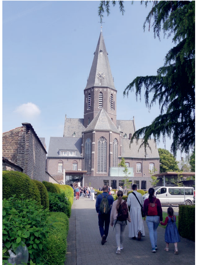
Église Sainte-Colette de Gand