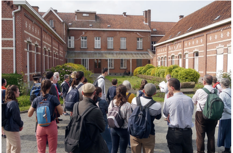
Couvent des Sœurs de Saint-Vincent de Paul de Moerzeke (arrière).