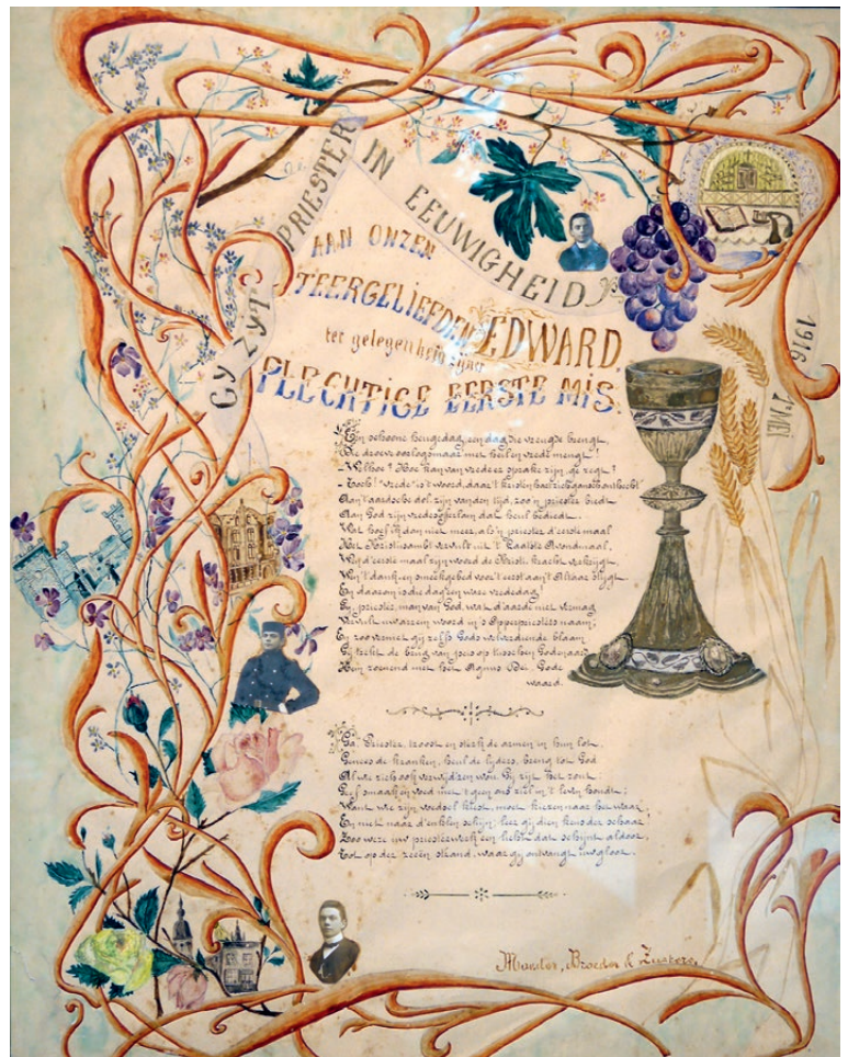
Dessin de la sœur de l'abbé Poppe pour son ordination (musée).

Pour mener à bien cette tâche, la Sainte Vierge lui