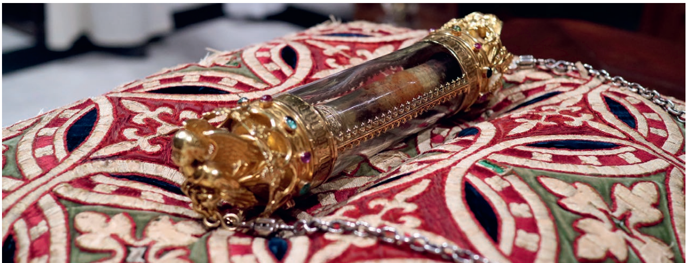
La Relique du Saint-Sang, vénérée depuis huit siècles à Bruges, en une solennelle procession, chaque Jeudi de l'Ascension.