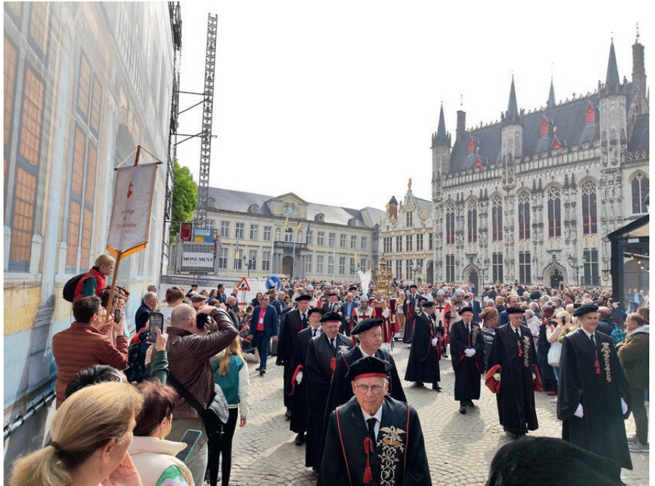
Transfert de la relique de la place du Burg à la cathédrale Saint-Sauveur.

Le 3 mai 1304, la relique fut portée pour la première fois au cours d’une procession dans la ville de Bruges. Depuis, chaque année, le Jour de l’Ascension, cette Procession parcourt les rues de la ville pavoisée. La “Noble Confrérie du Saint-Sang”, qui compte trente et un membres, est chargée de la garde de la Relique et de l’organisation de la Procession. Cette procession est un acte de foi public , auquel participent les autorités religieuses et civiles.