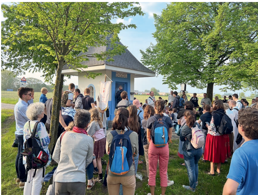
Chapelle des Bateliers, au nord du village, l'abbé Poppe s'y rendait souvent.

L'abbé Poppe était grand et maigre, il ne dépassait pas les cinquante kilos ! Désiré, le vieux jardinier du couvent encore robuste, porta le précieux fardeau jusqu'à destination, sous le regard édifié des habitants sortis sur le pas de leur porte. Le lendemain, un cortège plus nombreux participa à l'acte de