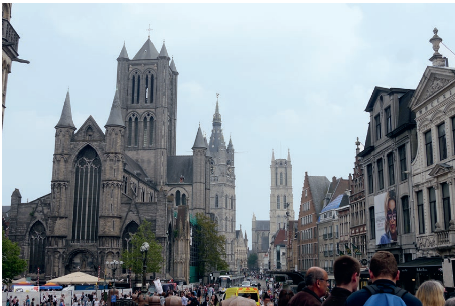
Centre historique de Gand : vue depuis le pont Saint-Michel, avec l'église Saint-Nicolas, le beffroi de la ville et la cathédrale Saint-Bavo.

« Jésus eucharistique, Dieu qui restez ici dans votre Tabernacle solitaire d'où vous cherchez toujours du regard et d'un grand désir toutes les âmes de Sainte-Colette et les attirez à Vous ! Vous les attirez à Vous, à votre amour, car Vous êtes Amour. Vous les invitez doucement : vous attirez même les cœurs fermés, désirant